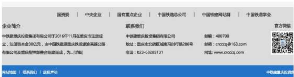
图 2-2-1 第一次公示截图