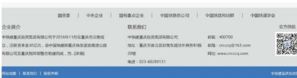
图 3-2-1 第二次公示截图